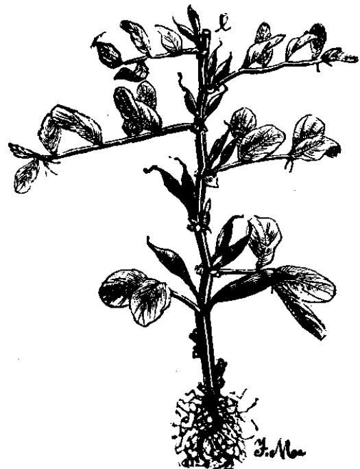
Puffbohne, in e entpitzt

Befall an den Triebspitzen und im Bereich der extrafloralen Nektarien in den Blattachseln. Die Triebspitzen sterben ab und die Pflanzen bleiben im Wuchs zurück. Es können auch Hülsen durch die Saugtätigkeit der Läuse verkrüppeln. Der Befall tritt in der Regel zuerst am Rand des Bestandes auf: Befallene Triebspitzen frühzeitig ausbrechen. Als Winterzwischenwirt kommen Pfaffenhütchen, Gemeiner Schneeball und Wohlriechender Pfeifenstrauch in Frage.