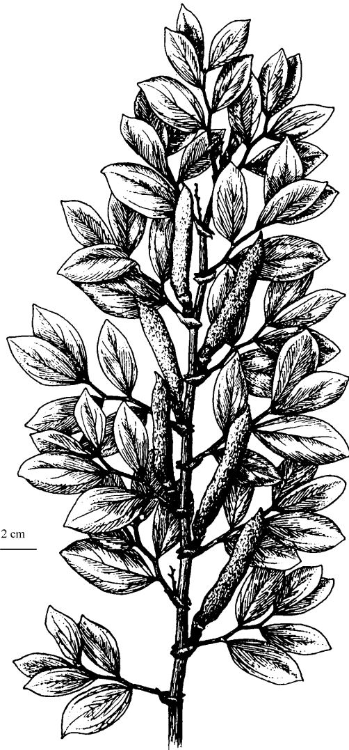
Vicia faba L.