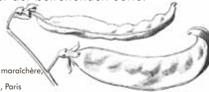
Zuckererbse "Corne de Béliar" Abb. aus: Cours pratique de culture maraîchère, Belgien 1923; Klischee von Vilmorin Andrieux & Cie, Paris

Zuckermarkerbsen (convar. medullasaccharatum [Körn.] Lehm.) stellen eine besondere Gruppe dar. Diese Erbsen besitzen ein gelbes, runzeliges Korn, entsprechen in diesem Merkmal also den Markerbsen. Ihre Hülsenwände sind besonders dick. Sie werden deshalb auch als Zuckerbrecherbsen bezeichnet. Geerntet werden sie in einem späteren Reifestadium, ähnlich wie die Brechbohnen. Die in der DDR entwickelten Sorten der Zuckermarkerbsen sind heute nicht mehr im Handel erhältlich. Ihnen gilt daher unser besonderes Augenmerk bei der Erhaltung. Den echten Zuckererbsen (convar. axiphium Alef.), auch Kiefelerbsen oder Kefen genannt, fehlt in der Hülse die pergamentartige Innenschicht. Sie besitzen runde Samen mit grünen, gelben oder auch mehrfarbigen Samenschalen. Ihre Blüten können weiß oder bunt sein. Es gibt unterschiedliche Hülsenformen und auch Sorten mit blauen oder gelben Hülsen. Bei den Schwartzuckererbsen , früher auch als Kaiserschoten bezeichnet, sind die Hülsen verbreitert. Alle rundkörnigen Zuckererbsen müssen für den Verzehr geerntet werden, wenn die Hülsen noch jung und zart sind. Werden die Samen dicker, beginnen sie Stärke einzulagern. Den richtigen Erntezeitpunkt festzustellen, gelingt nur dem Kenner der betreffenden Sorte.