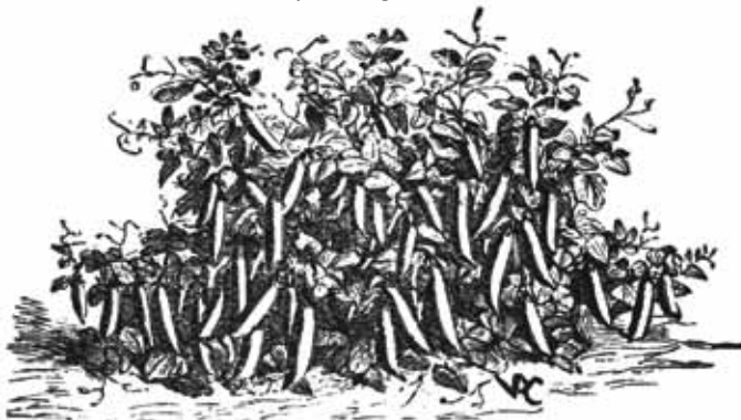
Niedrige, früh reifende Erbse "Merville d'Amérique" Abbildung aus: Cours pratique de culture maraîchère, Belgien 1923; Klischee von Vilmorin Andrieux & Cie, Paris

Erbsenhülsen unterscheiden sich in Farbe, Form und Größe. Die Farbe der Samenschalen variiert von gelb oder grün bis hin zu grau oder (rötlich)braun, violett und schwarz. Erbsensamen können einfarbig, marmoriert oder punktiert sein. Der Nabel ist weißlich oder dunkel, klein und rund bis elliptisch geformt.